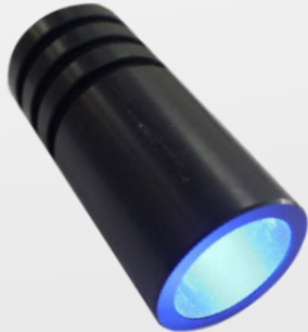
GÉNÉRATEUR LED RGB 3W