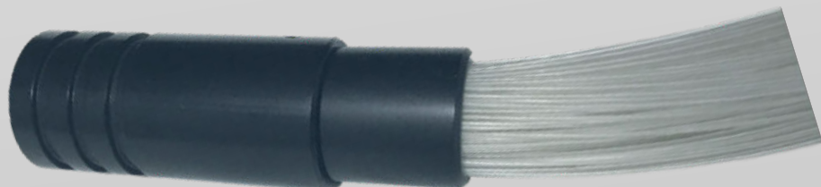
HARNAIS DE FIBRES OPTIQUES

INSÉRER L'EMBOUT COMMUN DANS LE GÉNÉRATEUR ET LE FIXER EN UTILISANT LA VIS PRÉVUE AU-DESSUS DU GÉNÉRATEUR.