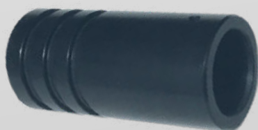
ILLUMINATORE LED 3W