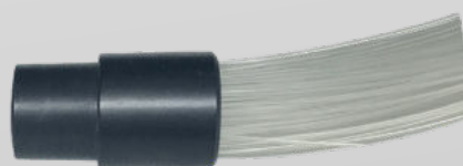
CONNETTORE COMUNE FASCIO A FIBRE OTTICHE