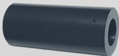
ILLUMINATORE RGB 9W