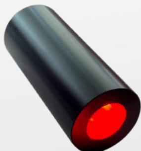
ILLUMINATORE RGB 9W