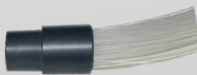
CONNETTORE COMUNE FASCIO A FIBRE OTTICHE