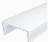
cover opale CV-A12/01-OP