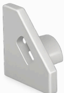
tappo forato TP-A12/01-T1