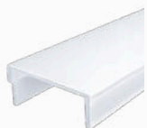
cover opale CV-RS16/01-OP