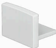
tappo chiuso TP-R16/01-T2