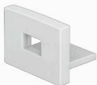
tappo forato TP-RS16/01-T1