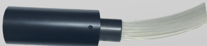
HARNAIS DE FIBRES OPTIQUES

INSÉRER L'EMBOUIT COMMUN DANS LE GÉNÉRATEUR ET LE FIXER EN UTILISANT LA VIS PRÉVUE AU-DESSUS DU GÉNÉRATEUR.