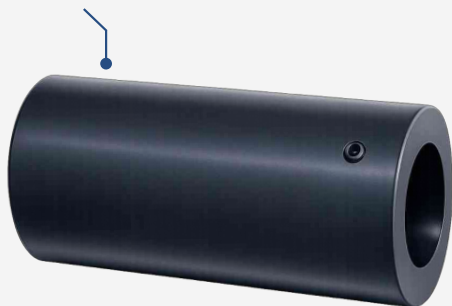
générateur LED RGB+W 12W