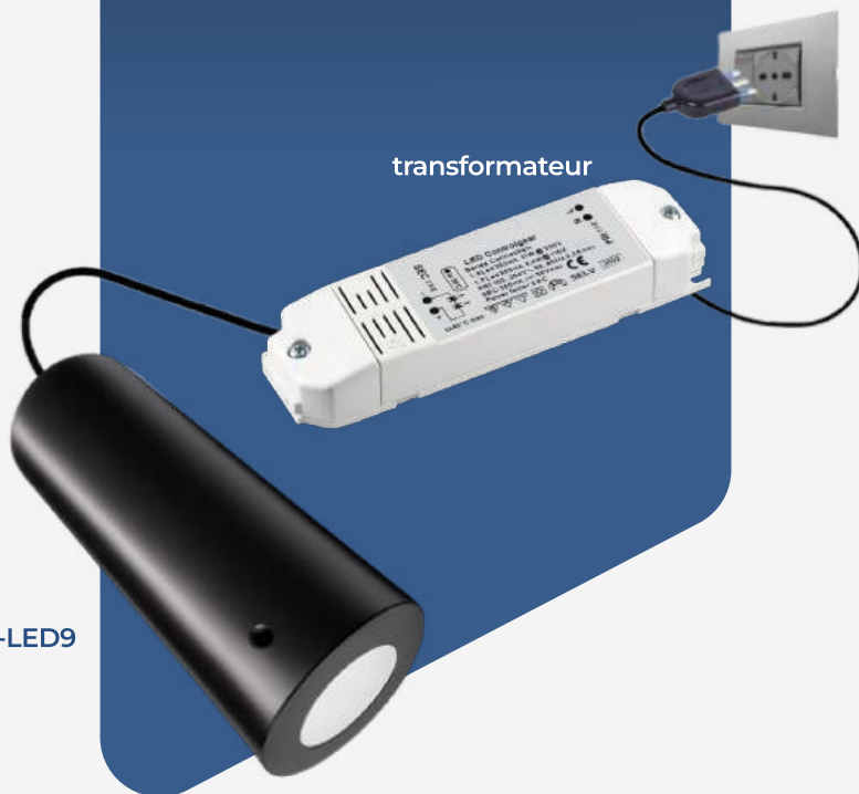
générateur LED LWH-LED9