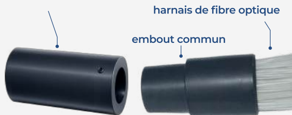
générateur LED LWH-LED9

insérer l'embout commun dans le générateur et le fixer en utilisant la vis prévue au-dessus du générateur.