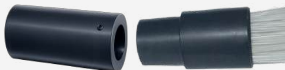
fascio a fibre ottiche connettore comune

inserire il connettore comune nell'illuminatore e bloccarlo tramite la vite predisposta sopra l'illuminatore