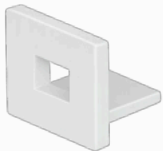
tappo chiuso TP-R16/02-T2