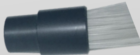
CONNETTORE COMUNE FASCIO A FIBRE OTTICHE